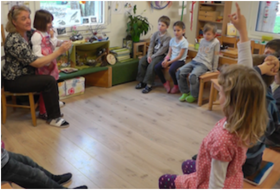
Abbildung 2: Rollenexternes Handeln.

Die Lehrerin unterstützt das Bühnenkind ausserdem, indem sie einen Grossteil der rollenexternen Kommunikation gegenüber dem Klassenplenum übernimmt: Sie registriert, was die Kinder im Publikum tun, und kommuniziert mit ihnen multimodal, indem sie sich verbal, paraverbal sowie durch Körper- und Blickensatz ausdrückt (vgl. Abbildung 2). Während das Bühnenkind seinen Teil der Rolle ausfüllt, signalisiert die Lehrerin auf diese Weise, dass sie an Wortmeldungen Interessierte gesehen hat. Zudem validiert oder sanktioniert sie das Handeln der PublikumsKinder (sie sollen aufstrecken und nicht dreinschwatzen).