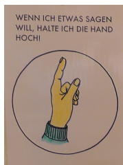
Abbildung 5: Objektivierung der Regel «aufstrecken, um zu sprechen» als Symbolkarte

nun die Standardsprache. Damit vollzieht sie deutlich den Wechsel zum (im Vergleich zur Einstiegsphase) formelleren Unterrichtsgespräch.