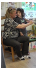
Abbildung 1: «Inkorporieren» und rolleninternes Handeln.

Die Lehrerin baut die Vogelquiz-Interaktion in spezifischer und höchst funktionaler Weise: Sie lässt das Bühnenkind nicht alleine auf der Bühne, sondern «inkorporiert» es, indem sie es mit beiden Armen umfasst und ihm die Vogelkarte vor die Augen hält (vgl. Abbildung 1). Auf diese Weise steht das Bühnenkind für alle gut sichtbar unter dem – auch körperlich deutlich markierten – Schutz der Lehrerin. Das Bühnenkind ist damit Teil der Bühnenrolle mit ihren Rechten und Pflichten, steht aber nicht alleine da, sondern hat in der Person der Lehrerin eine Beraterin, Assistentin und Souffleuse hinter sich stehen.